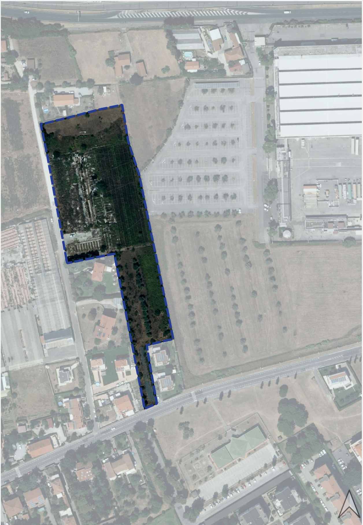
ESTRATTO AREA DI TRASFORMAZIONE SU ORTOFOTO AGEA 2021