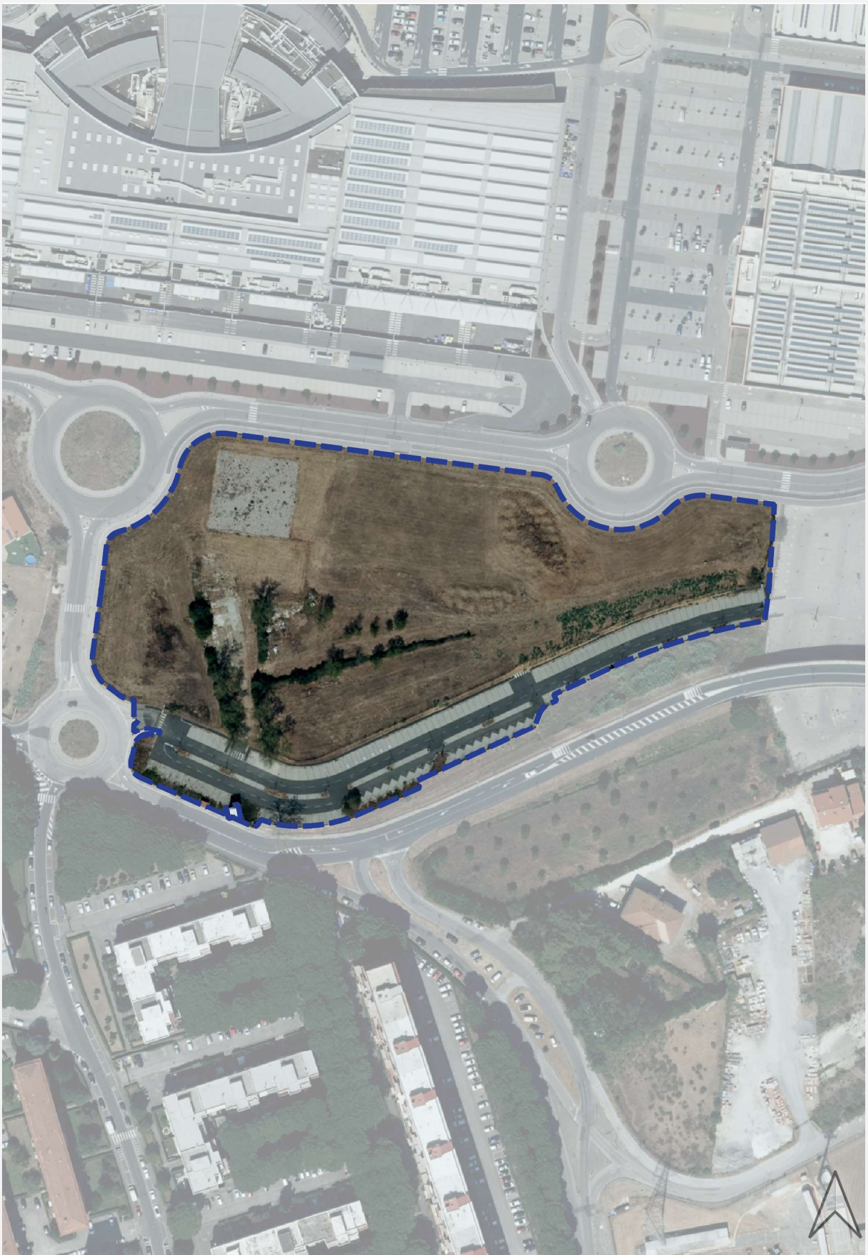
ESTRATTO AREA DI TRASFORMAZIONE SU ORTOFOTO AGEA 2021